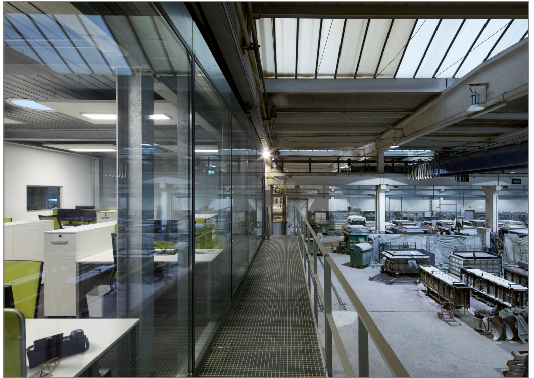
Symbiose Büro und Werkstatt